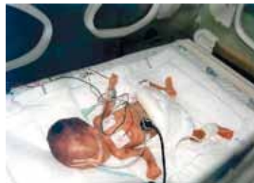
Ko se je rodil, je bil najmanjši in najmanj donošen novorojenček v porodnišnici.